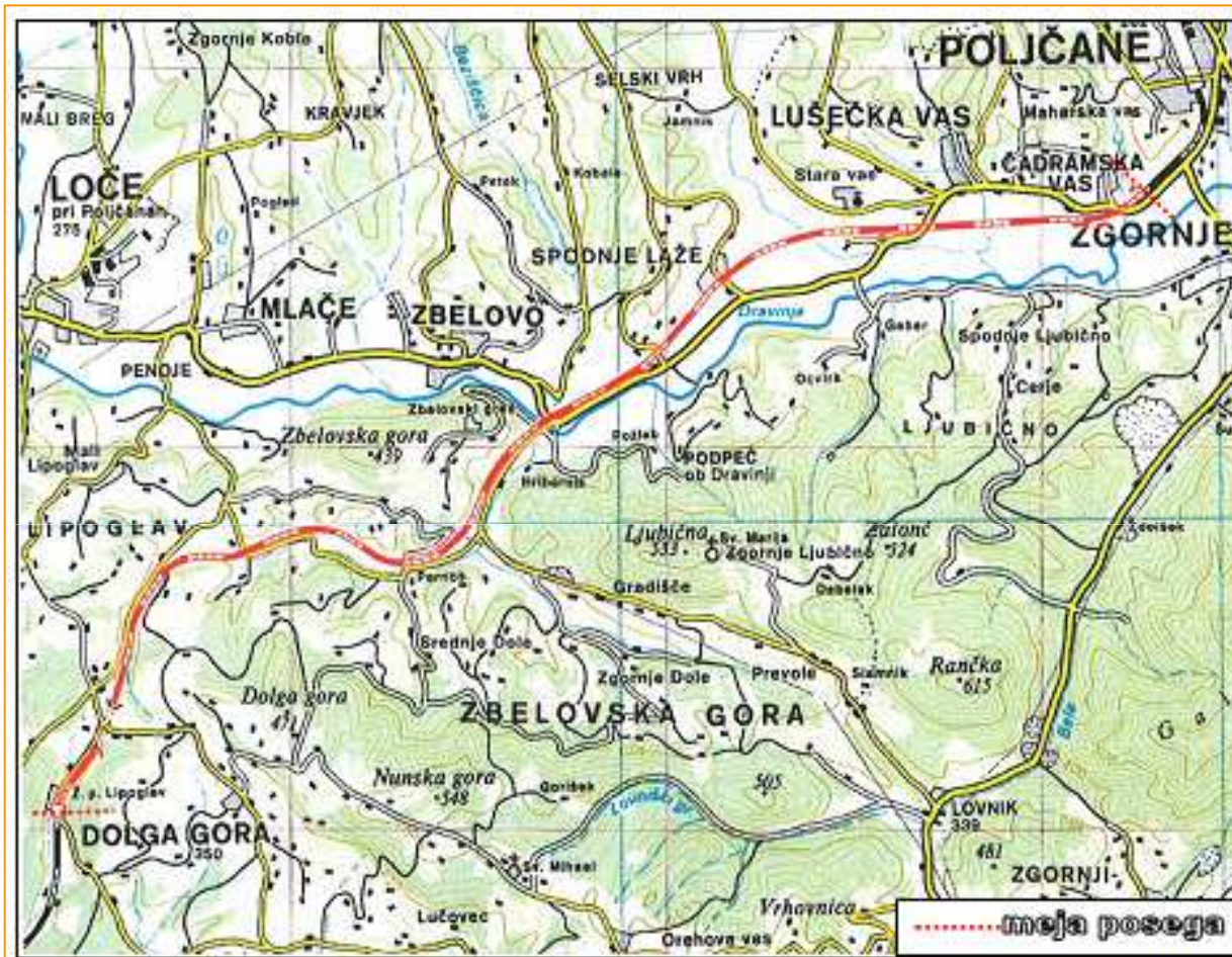
Slika 1: Odsek železniške proge Dolga Gora – Poljčane